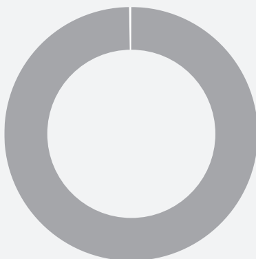
1. Taxonomie-Konformität der Investitionen einschließlich Staatsanleihen

■ Taxonomiekonform ■ Andere Investitionen